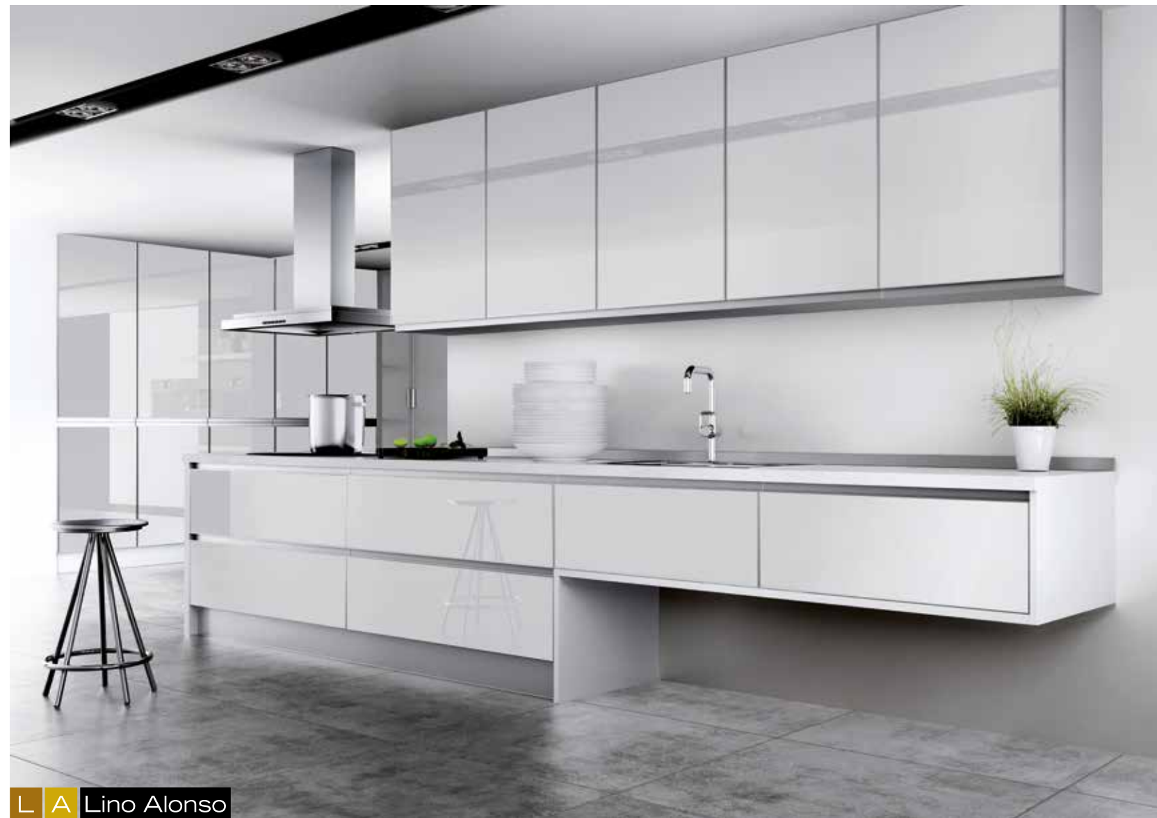
L A Lino Alonso