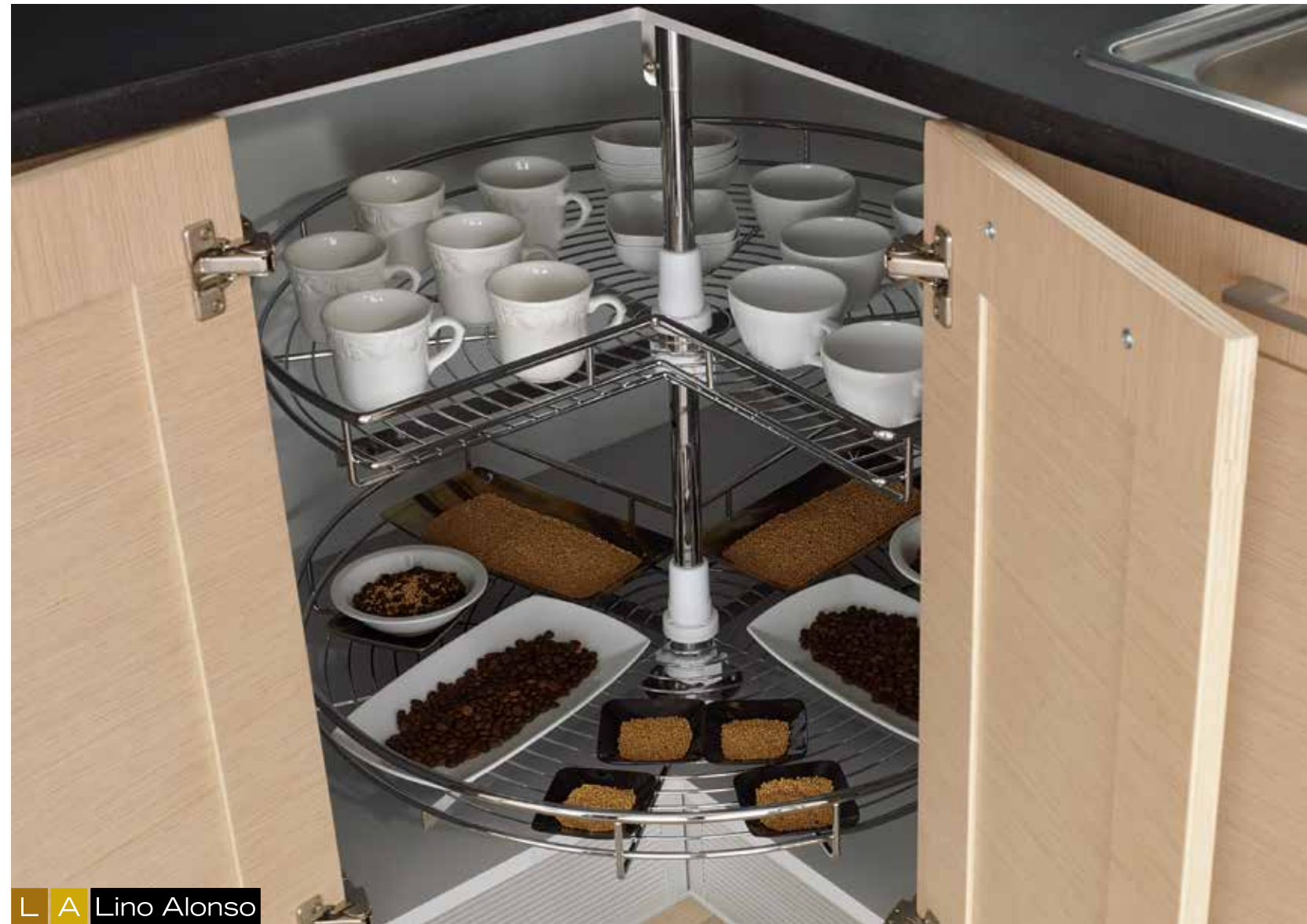
L A Lino Alonso