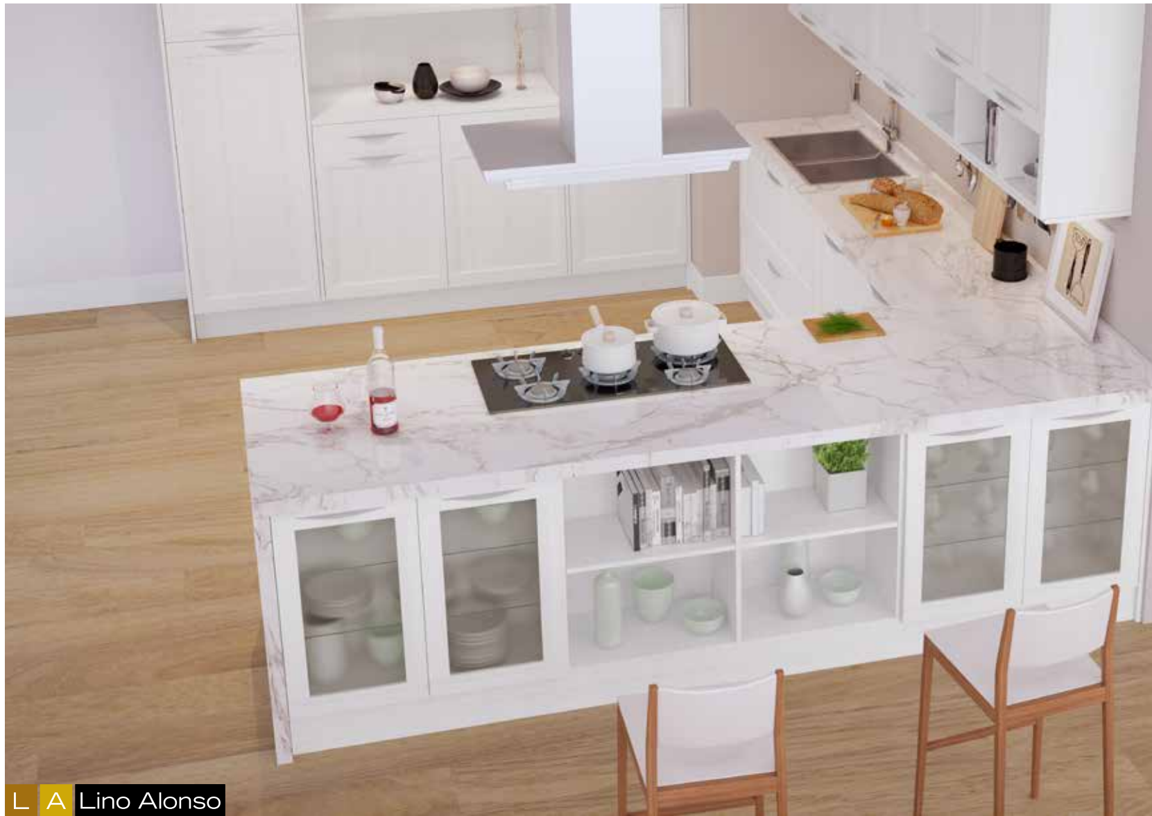
L A Lino Alonso