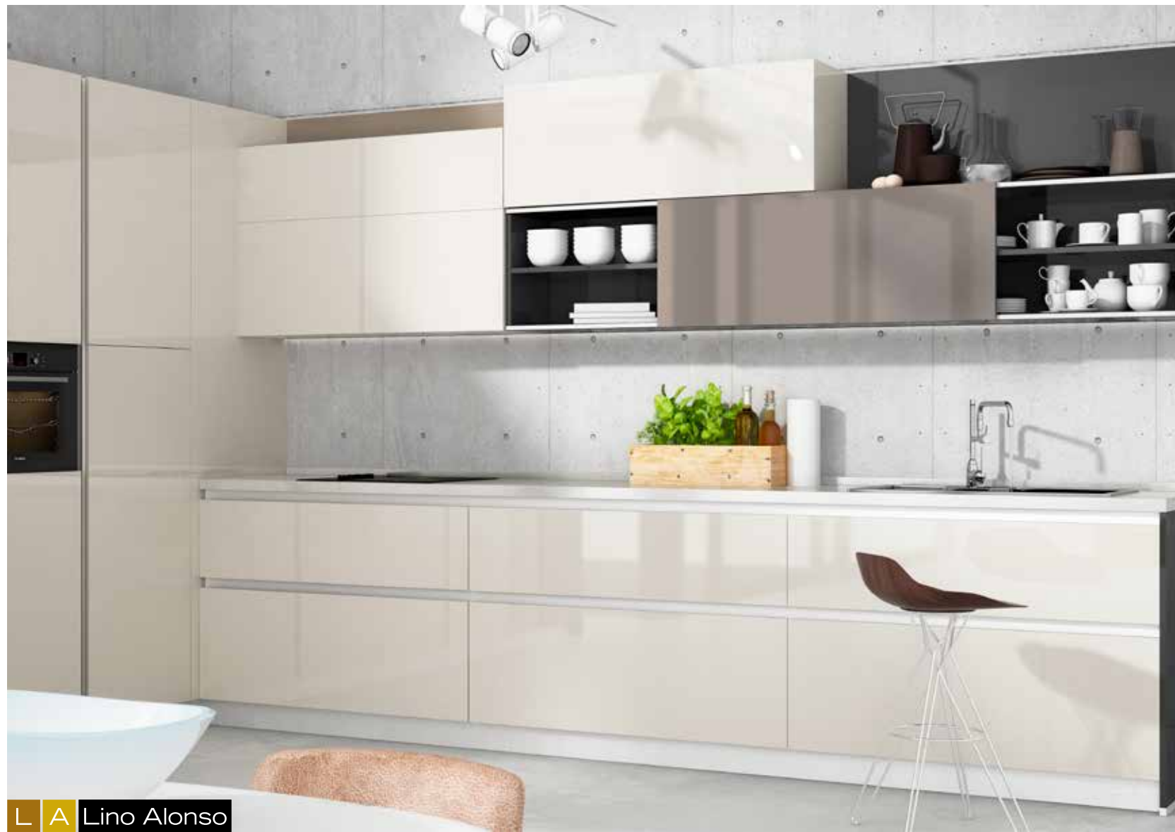
L A Lino Alonso