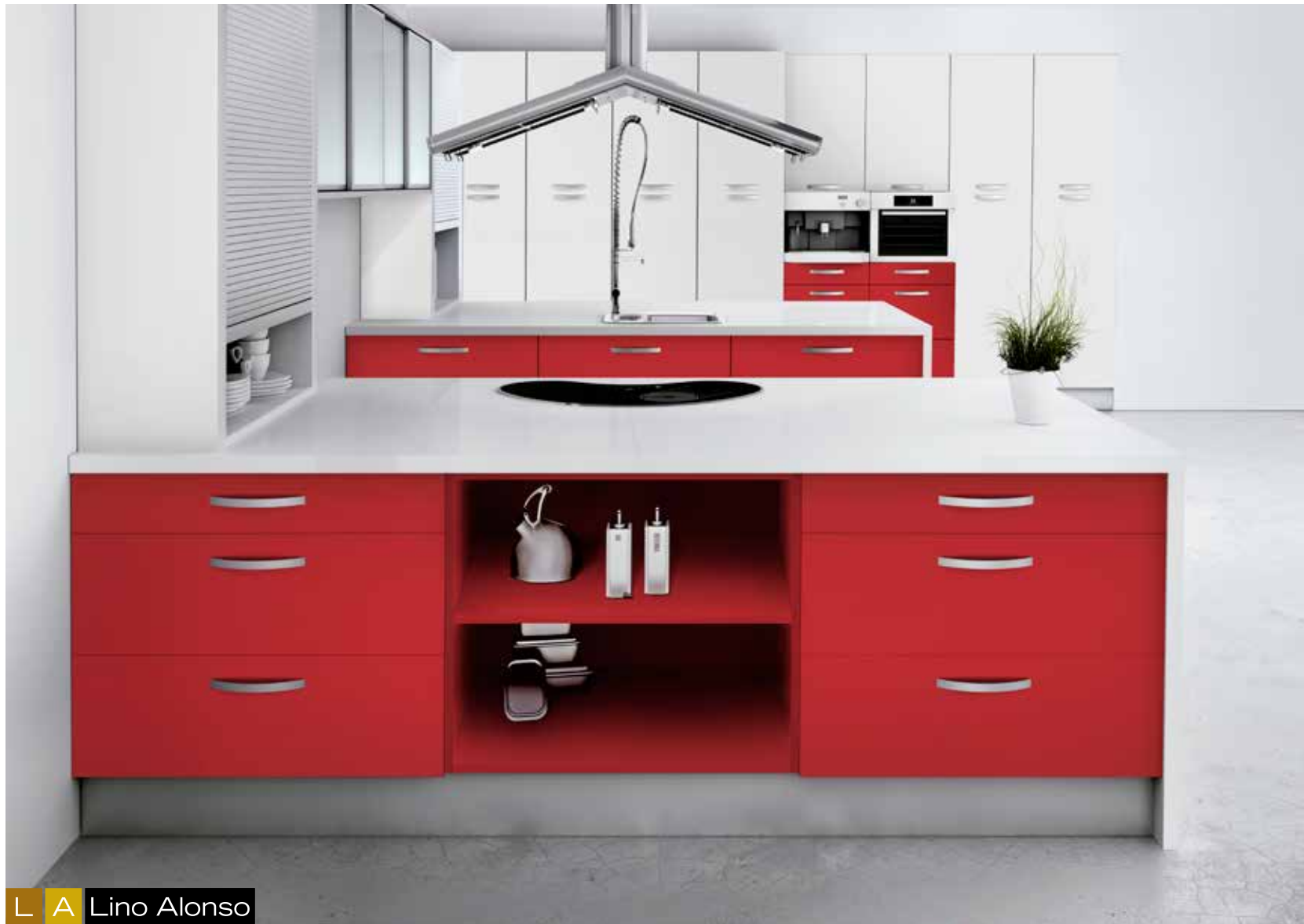
L A Lino Alonso