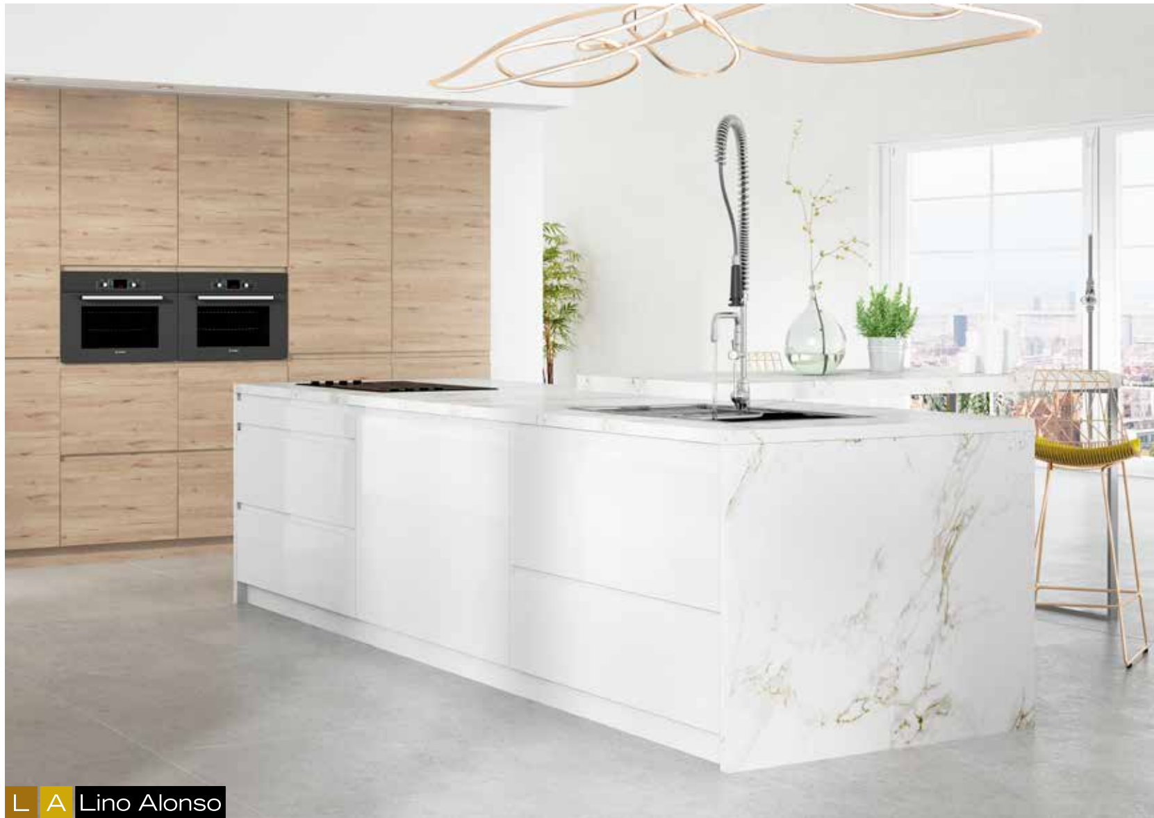
L A Lino Alonso