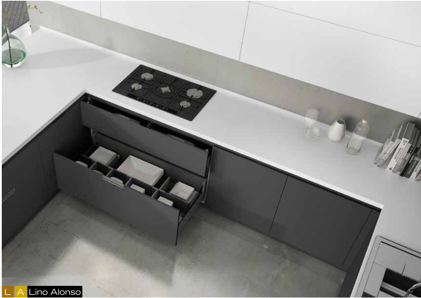
L A Lino Alonso